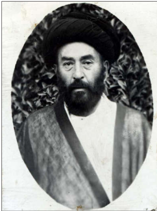
سید محمد امامزاده، امام جمعه تهران