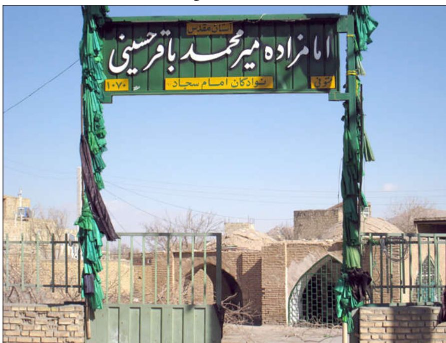
مقبره میر محمد باقر خاتون آبادی