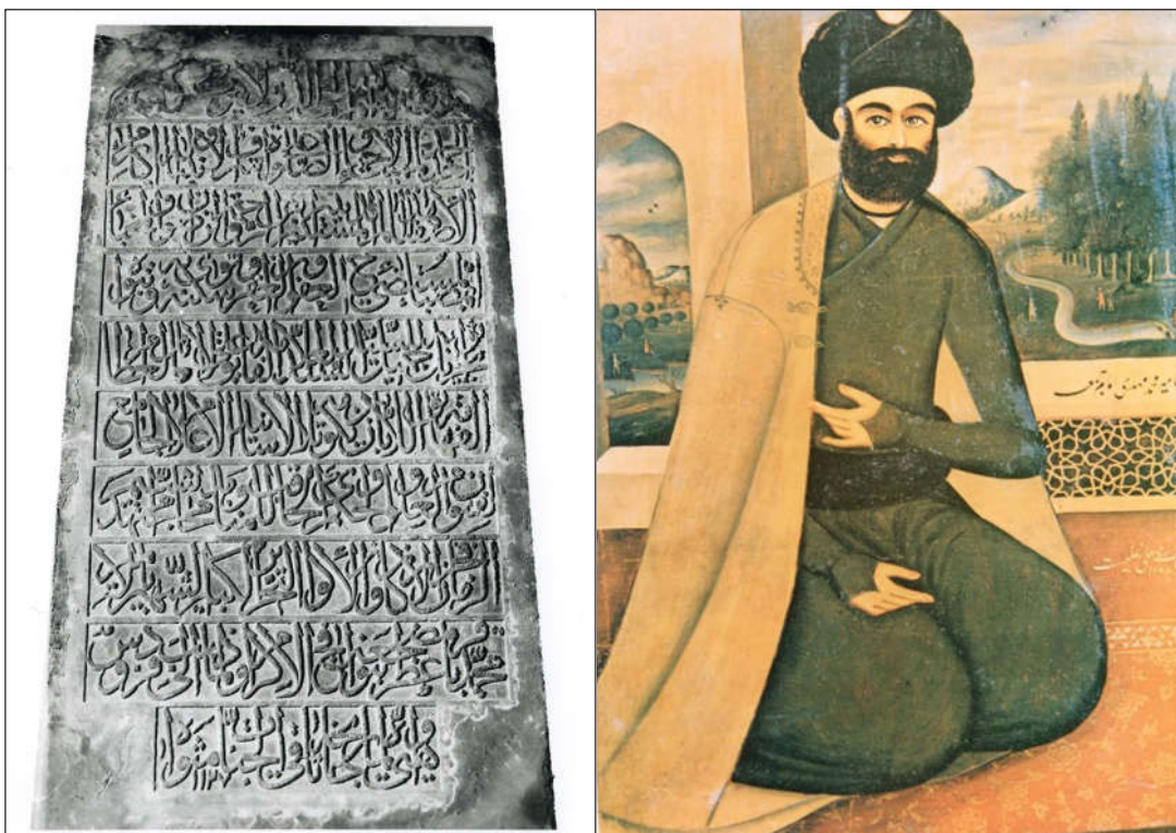
سنگ مزار مير محمد باقر ملاباشی زمان شاه سلطان حسين

يا للعراقين من فقدان سيدهم من فقهه حصن دين الله مثلهم لما تهدم ركن العلم و الأدب قال المورخ: ركن الفضل منهدم سيد العراقين چند فرزند داشته، از جمله: سيد مصطفى المدرّس از فضلاء، که در ۱۴۰۳ ق وفات کرده و در جوار پدر دفن شده است.