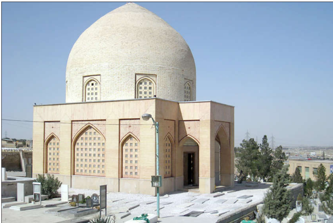
مقبره میر عماد

در اصفهان از محضر آخوند ملاّ حسینعلی تویسرکانی، و در نجف از شیخ مرتضی انصاری و شیخ محمد حسین قزوینی ۲ استفاده نموده، و پس از بازگشت به اصفهان به امامت در مسجد جامع عباسی پرداخته. به سال ۱۳۰۹ق وفات کرده و پیکرش به نجف اشرف حمل گردیده. در شجره نایب الصدر آمده: <له کتب فی الفقه، و کتاب مدوّن فی المذاهب>. ۳