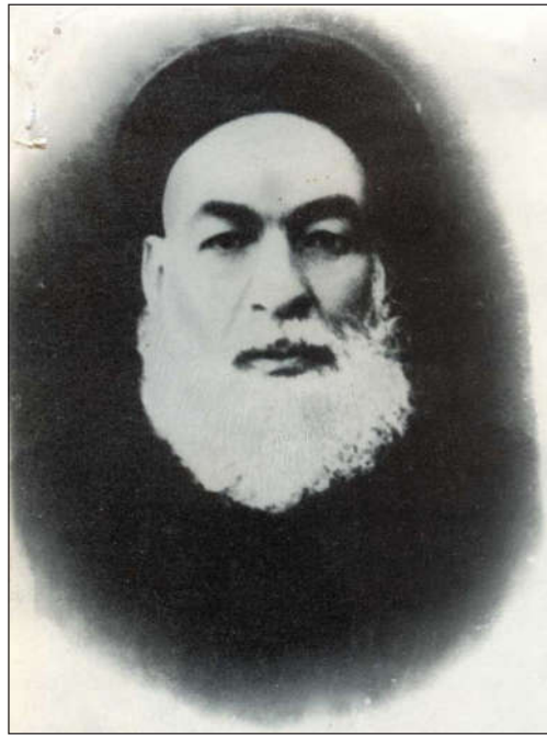
آیت الله حاج آقا یحیی سجادی

ولادتش: محرم ۱۰۹۳ در مدینه. قبر وی نیز در مدینه مشرفه است. ۱