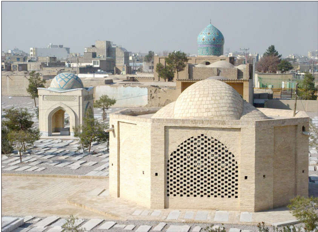
مقبره سید العراقین و میر محمد صادق خاتون آبادی

فرزندش: حاج میر محمود مردی عالم و زاهد و قانع بوده. به امامت در مسجد آقا علی بابا اشتغال داشته، و در منزل تدریس می نموده. و تألیفاتی از خود به یادگار نهاده است. ۱ وفاتش: ۱۸ ذی الحجه ۱۳۵۴ق و مدفنش تکیه سید العراقین، ماده تاریخ وفاتش را میرزا عبدالجواد خطیب چنین سروده است: <آن همه اوصاف محمود عاقبت محمود شد.> فرزندش: سید حسین خاتون آبادی متخلص به <آزاد> از فضیلت پرتلاش اصفهان بود که در مهر ماه ۱۳۵۹ش وفات کرد و در تکیه خاتون آبادی مدفون شد.