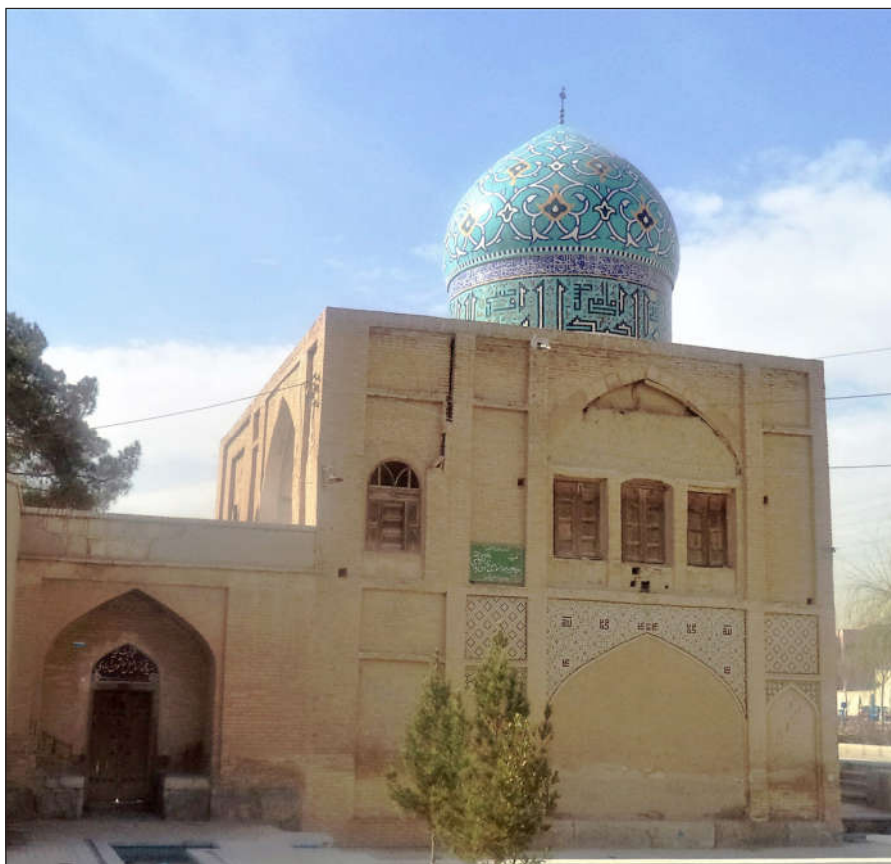
تکیه میر محمد اسماعیل خاتون آبادی