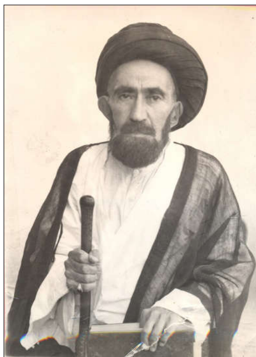
حاج میرزا حسن امام جمعه اصفهان