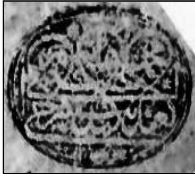
۱۷. نقش مُهر به شکل بیضی و خط ثلث تزیینی دوره قاجار با متن: العبد المذنب الراجی محمد هاشم الحسینی