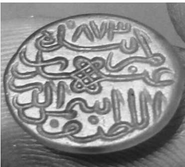
۳. مُهر از جنس عقیق نارنجی رنگ به شکل گرد و خط ثلث با سجع: بنده کمترین عبداللطیف شمس الدین ۸۷۳ (تاریخ)