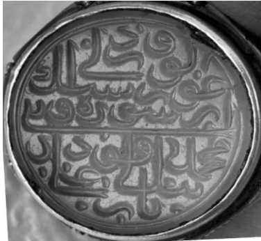
۶. مُهر از جنس عقیق زرد به شکل گرد و خط ثلث دوره تیموری با سجع به زبان ترکی: محمدقولی بیگ یار علی در- اعورلوسون سنک اُ ره نبی و ولی در