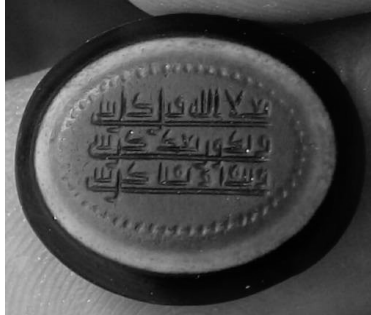
۱. مُهر از جنس عقیق سه پوست به شکل بیضی و خط کوفی با متن: تعلا الله قبل کل شیء - و یدور بعد کل شیء - و یبقا و یفنا کل شیء