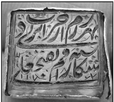
۲۲. مُهر از جنس شیشه به شکل چهار گوش و خط نستعلیق دوره صفوی با سجع: بهر رزم از جرات پر دلی / شکافم سپه را بفتحعلی ۱۱۰۷ (تاریخ)