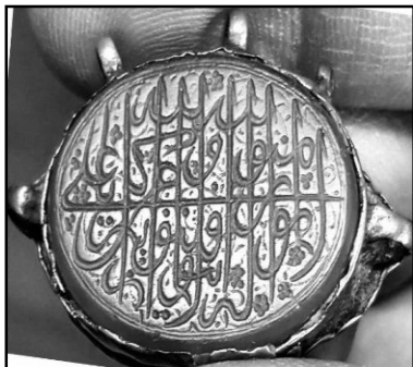
۱۵. مُهر از جنس عقیق نارنجی رنگ به شکل بیضی و خط ثلث دوره قاجار با متن: اللّهُ لَا إِلَهَ إِلَّا هُوَ وَعَلَى اللَّهِ فَلْيَتَوَكَّلِ الْمُؤْمِنُونَ