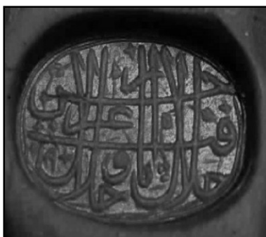
۱۶. نقش مُهر به شکل بیضی و خط ثلث دوره قاجار با متن: جلال یافت ازو حُسن عز و جلال