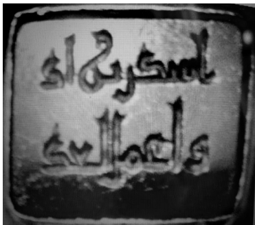
۲. مُهر از جنس عقیق سرخ به شکل چهارگوش و خط کوفی با متن: اشکر بزاد و اعمل لغد - برای زاد و توشه ات شکر کن و برای فردا عمل کن