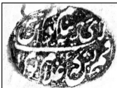
۱۹. نقش مُهر به شکل بیضی و خط ثلث دوره قاجار با سجع: ای شه لب تشنه بنام توم (توام) / هم این قسم بس که غلام توم