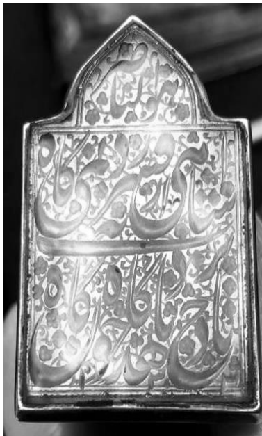
۱۸. مُهر از جنس کریستال سبز، به شکل چهارگوش کلاهدار، به خط نستعلیق و سجع: هوالنصر، افسر شاهی نمی‌ارزد به گاه / تاج بر بادت دهد چون گاه گاه، ۱۳۰۳ (این مُهر به احتمال بسیار متعلق به ابوالقاسم ناصرالملک است و نه ناصرالدوله. او در این سجع به کنایه و ایهام به سرنوشت پادشاهی محمدعلی شاه قاجار که با او مخالفت داشت و نیز احمد شاه که نایب السلطنه او بود اشاره دارد. و تاریخ ۱۳۰۳ بی شک خورشیدی است.)