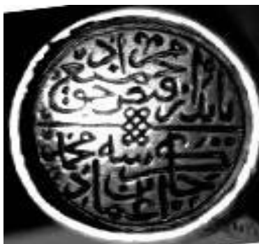
۴. مُهر از جنس عقیق سرخ به شکل گرد و خط ثلث دوره تیموری با سجع: یابد از فیض حق جمیع مراد - چاکر شه محمدبن عماد