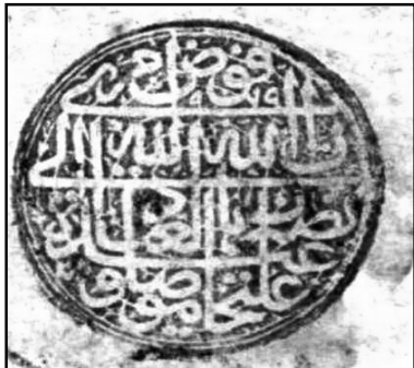
۱۴. نقش مُهر به شکل گرد و خط ثلث دوره صفوی با متن: افوض امری الی الله ان الله بصیر بالعباد الله، عبده علیخان موصلو