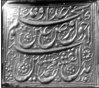
۲۰. نقش مُهر به شکل چهار گوش و خط ثلث دوره قاجار با سجع: بحکم خداوند چون فرض عین / کنده بدل نقش محمدحسین ۱۲۱۶