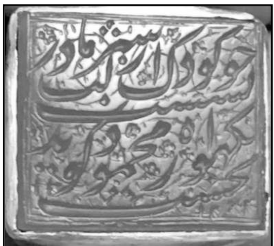
۲۳. مُهر از جنس عقیق نارنجی رنگ به شکل چهار گوش و خط نستعلیق دوره قاجار با سجع: چو کودک لب از شیر مادر گسست / بگهواره محمود گوید نخست ۱۲۸۳ (تاریخ)