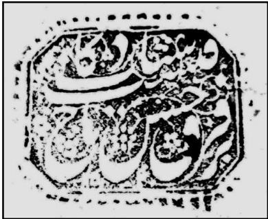
۲۱. نقش مُهر به شکل هشت گوش و خط نستعلیق دوره قاجار با سجع: برفرق حسن تاج سیادت کافیت