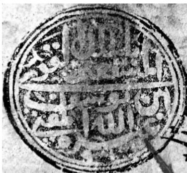
۸. نقش مُهر به شکل گرد و خط ثلث دوره تیموری با متن: المستغنی بالملک القوی عبدالله ابن یوسف المفتی