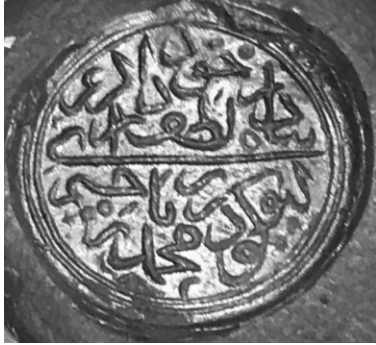
۵. نقش مُهر به شکل گرد و خط ثلث دوره تیموری با سجع: در پناه لطف خود دار ای کریم / گیو گودرز محمد یا رحیم