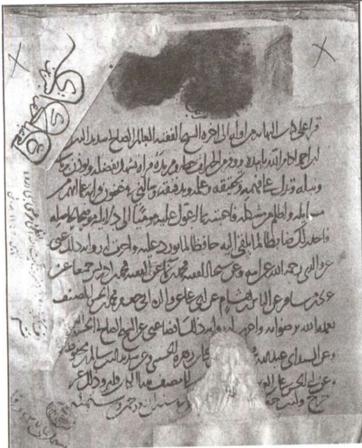
تصویر یک صفحه از نسخه نهایی شیخ طوسی (نسخه شماره ۳)

آیه الله شیخ ابوالقاسم محمدی گلپایگانی به ایشان هدیه کرده و ایشان در این کتاب‌خانه قرار داده‌اند.